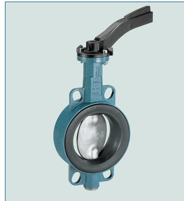
Версия с алюминиевым корпусом: DN 50 - DN 400